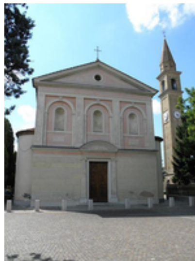
Figura 1: Chiesa di Sant'Andrea Apostolo