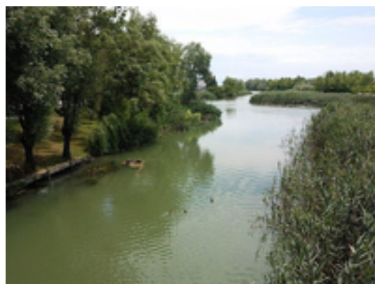
Figura 6: Caposile

9 - Distanza lungo il percorso: 34.81 km