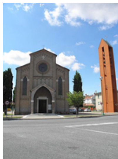
Figura 2: Chiesa della Natività di Maria

La prima citazione di una chiesa a Dese risale al 957. Si sa che nel 1152 papa Eugenio III sancì che la pieve di Dese avrebbe dovuto dipendere dal vescovo di Treviso.