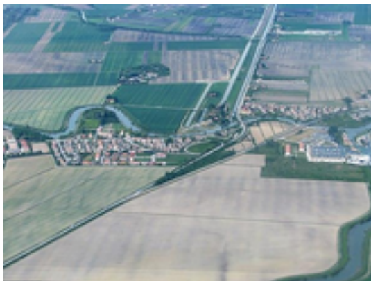
Figura 5: Portegrandi

ove inizia il Silone, diramazione del fiume Sile che ne segue l'antico corso. In quest'ambito, la località rappresenta una tappa fondamentale per il traffico navale da e verso la Laguna.