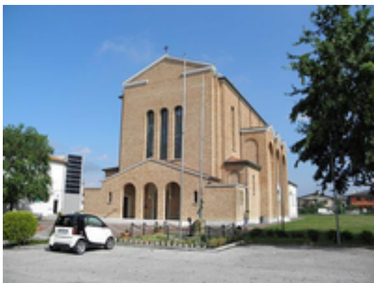
Figura 4: San Liberale (Fonte: Threecharlie )

Anticamente l'attuale San Liberale rappresentava la porzione orientale del territorio di Gaggio. Località