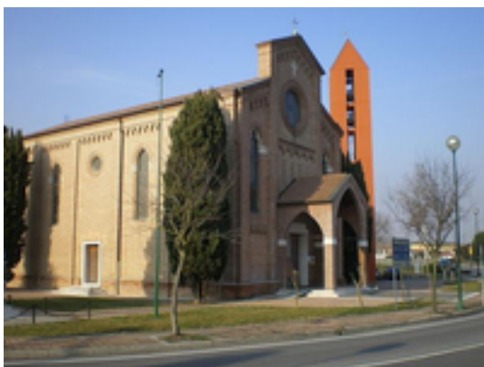
Figura 3: Dese

Dese è una località del comune di Venezia compresa nella Municipalità di Favaro Veneto. Rappresenta l'ultimo centro abitato del comune prima del confine con Marcon. Il nome è legato al fiume omonimo che scorre nei pressi dell'abitato.