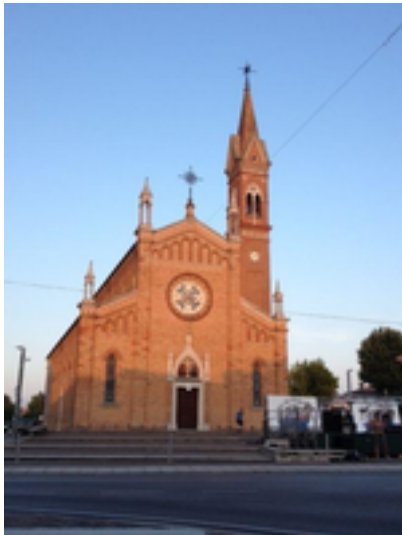
Figura 7: Musile di Piave

Musile di Piave è un comune italiano di 11 486 abitanti della città metropolitana di Venezia in Veneto. Il comune è situato sulla riva destra del Piave, una ventina di chilometri prima della foce del fiume, in una fascia interamente pianeggiante. Confina a sud-ovest con la Laguna Veneta. Larga parte del territorio è stato strappato alle paludi attraverso le bonifiche di fine Ottocento e degli anni Venti del Novecento .